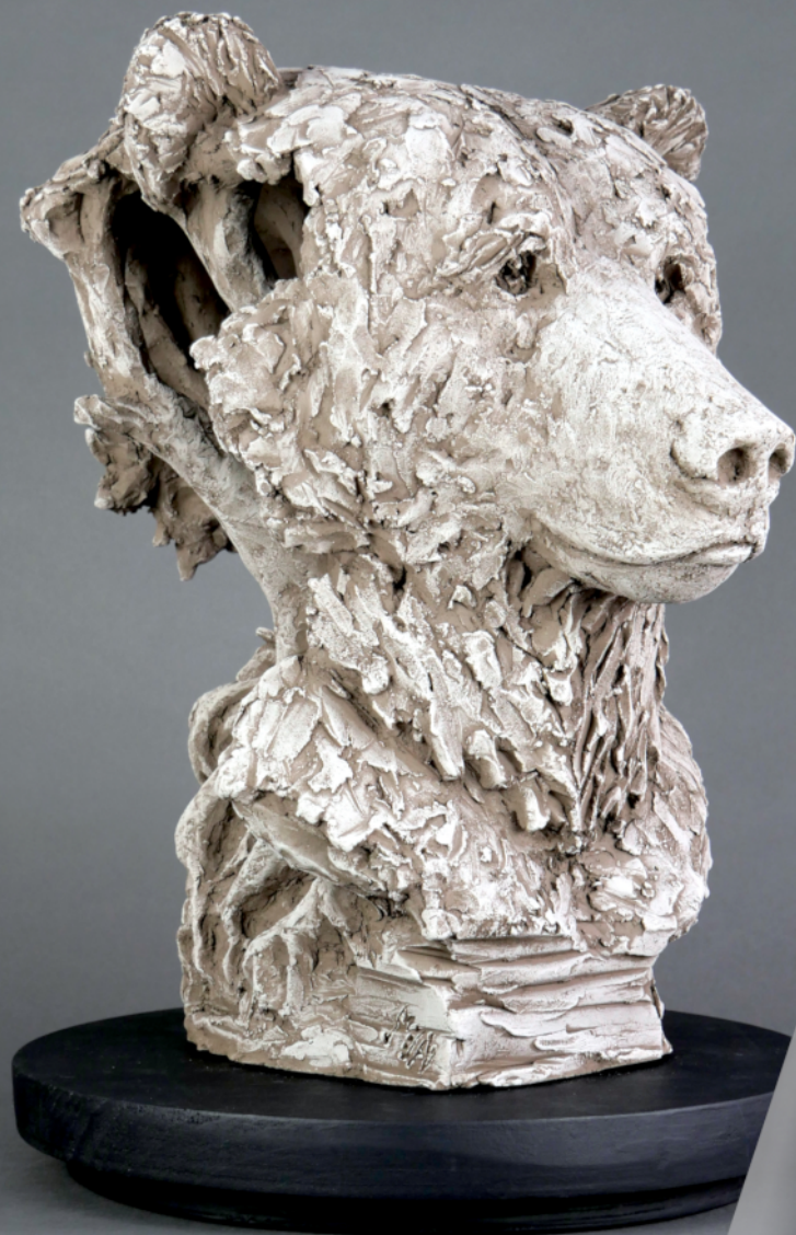
« Reines » - Céramique - 44 x 36 x 32 cm (Valem)